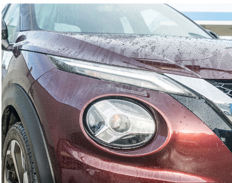
Des feux de jour en forme de faucille.