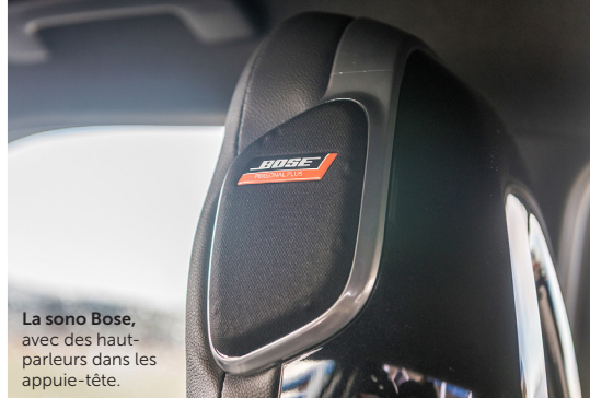
La sono Bose, avec des haut-parleurs dans les appuie-tête.