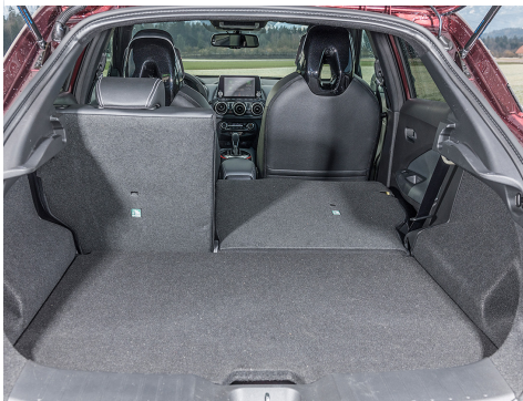
455 litres, le coffre du Juke est assez spacieux.