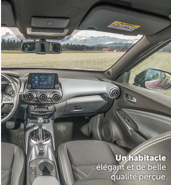
Un habitacle élégant et de belle qualité perçue.