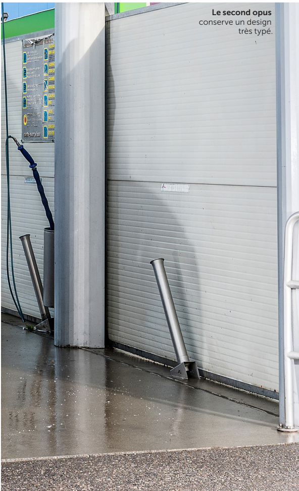
Le second opus conserve un design très typé.