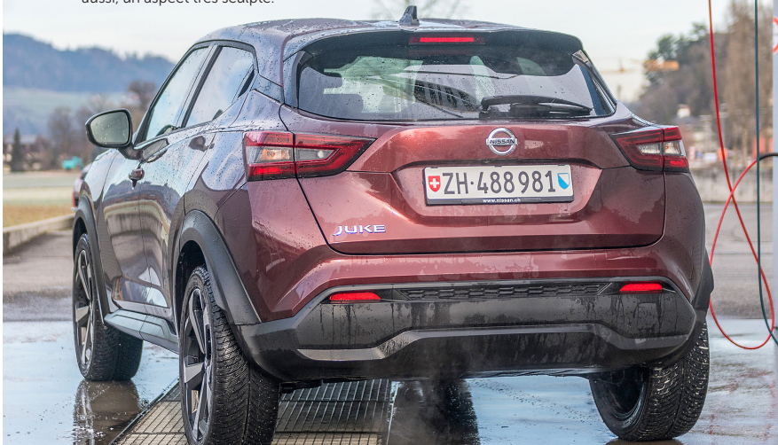
La partie arrière présente, elle aussi, un aspect très sculpté.