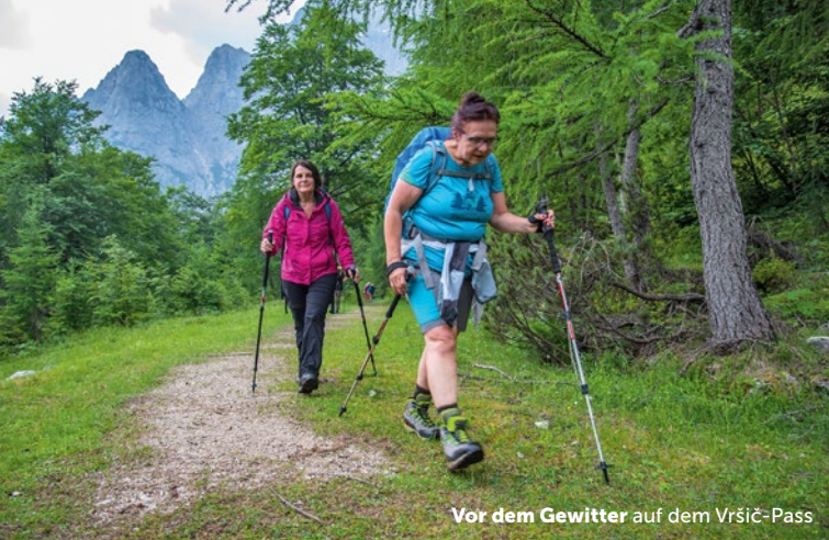
Vor dem Gewitter auf dem Vršič-Pass

Schwere Wolken hingen über dem Vršič-Pass und verdeckten die schroffen Gipfel der Julischen Alpen komplett. Kaum bei der russischen Kapelle angekommen, begann es zu regnen. Hastig klaubten wir – ich war mit einer fidelen Frauenwandergruppe aus Österreich unterwegs – die Regenkleider aus dem Rucksack und wanderten weiter bergauf. Immerhin sank die Temperatur um ein paar Grad und auch der aufkommende Wind sorgte für angenehmere Wanderbedingungen. Dann lichteten sich die Wolken plötzlich und in der Felswand war klar und deutlich das Felsengesicht der Jungfrau, sichtbar. Vorbei an blühendem Türkenbund und Akeleien erreichten wir bei immer stärker werdendem Regen die Schutzhütte Tičarjev am 1611 Meter hohen Pass. Kaum trat die Gruppe über die Türschwelle, durchzuckten in rascher Folge Blitze die Umgebung und kurz danach entlud sich ein heftiges Gebirgs Gewitter mit Sturmböen und Hagel. Somit