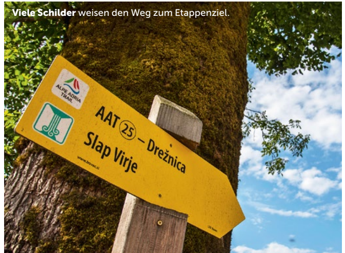
Viele Schilder weisen den Weg zum Etappenziel.