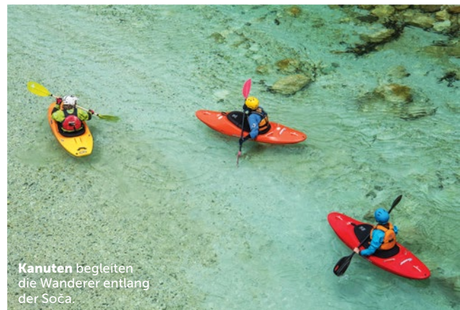
Kanuten begleiten die Wanderer entlang der Soča.