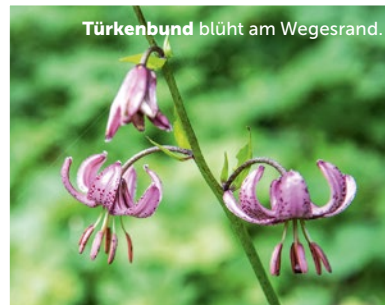
Türkenbund blüht am Wegesrand.