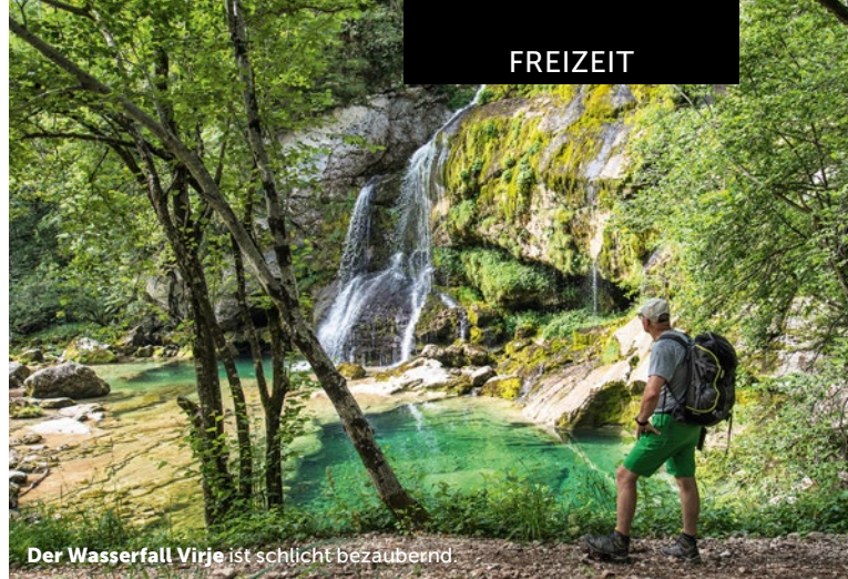
Der Wasserfall Virje ist schlicht bezaubernd.