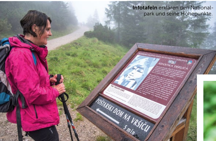
Infotafeln erklären den Nationalpark und seine Höhepunkte.