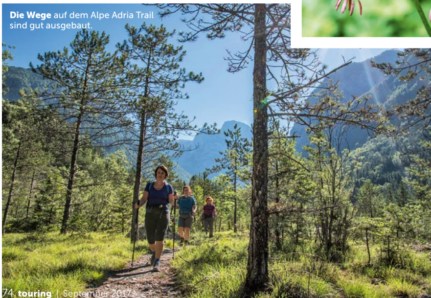
Die Wege auf dem Alpe Adria Trail sind gut ausgebaut.