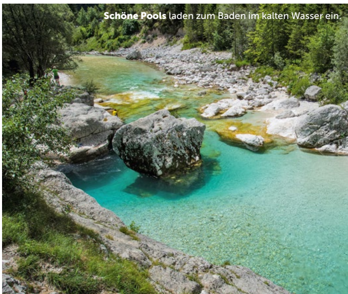
Schöne Pools laden zum Baden im kalten Wasser ein.